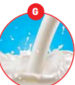
G MILCH VON SÄUGETIEREN UND MILCHERZEUGNISSE (INKLUSIVE LAKTOSE)