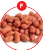
F SOJABOHNEN UND DARAUS GEWONNENE ERZEUGNISSE