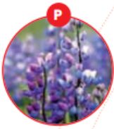
P LUPINEN UND DARAUS GEWONNENE ERZEUGNISSE