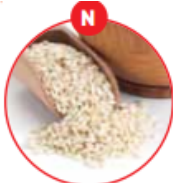
N SESAMSAMEN UND DARAUS GEWONNEN ERZEUGNISSE