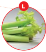
L SELLERIE UND DARAUS GEWONNENE ERZEUGNISSE