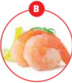
B KREBSTIERE UND DARAUS GEWONNENE ERZEUGNISSE