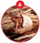
A GLUTENHALTIGES GETREIDE UND DARAUS GEWONNENE ERZEUGNISSE