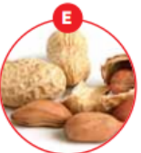
E ERDNÜSSE UND DARAUS GEWONNENE ERZEUGNISSE