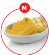
M SENF UND DARAUS GEWONNENE ERZEUGNISSE