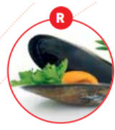
R WEICHTIERE WIE SCHNECKEN, MUSCHELN, TINTENFISCHE UND DARAUS GEWONNENE ERZEUGNISSE