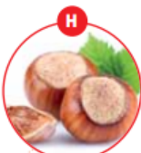
H SCHALENFRÜCHTE UND DARAUS GEWONNENE ERZEUGNISSE