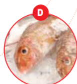
D FISCH UND DARAUS GEWONNENE ERZEUGNISSE