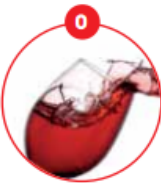
O SCHWEFELDIOXID UND SULFITE